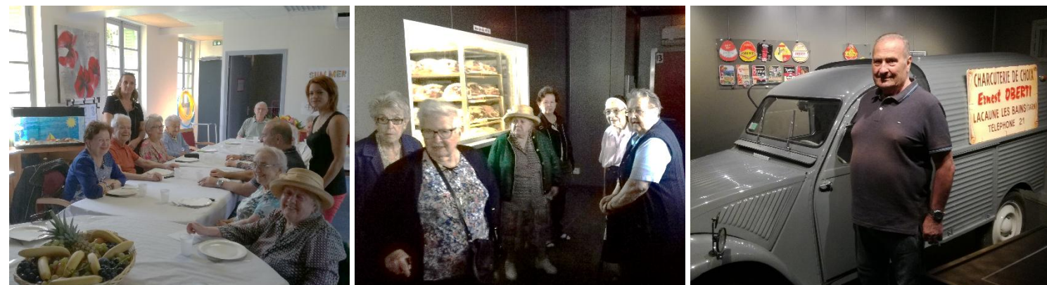
Mardi 18 septembre, c'était à notre tour d'être invités ! L'Accueil de Jour Agoût-Montalet nous a aimablement reçus sur le site de Lacaune pour une découverte des lieux, un repas convivial et une visite guidée fort intéressante de la Charcuterie Oberti... Une journée ensoleillée et réussie.