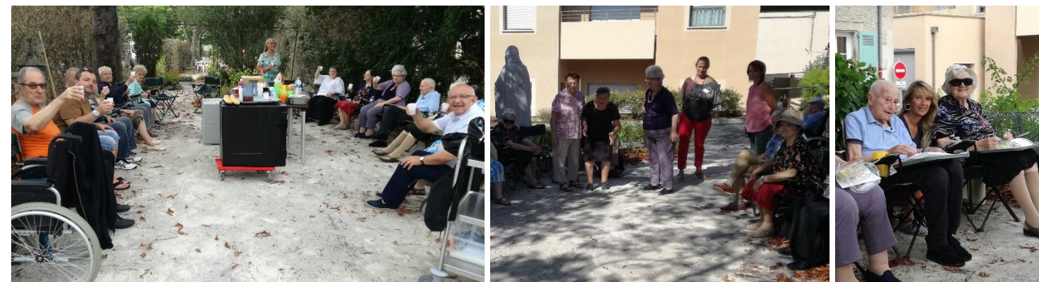
Journée partagée avec des résidents de l'EHPAD des Moulins de Puylaurens : pique-nique dans le parc ! à l'ombre des marronniers, et partie de pétanque.