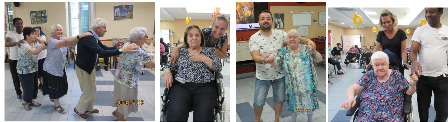
Atelier danse un lundi sur deux, adapté y compris pour les personnes à mobilité réduite !